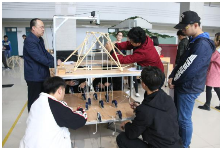
比赛现场