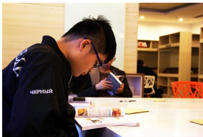
学生远离手机阅读书籍

为响应世界读书日的号召，4月22日，经管学院于图书馆一楼至二楼举办了面向全校学生的“阅读一小时”读书挑战赛。本次活动由经管学院学生会外联部主办，行政管理 1601 团支部协办。