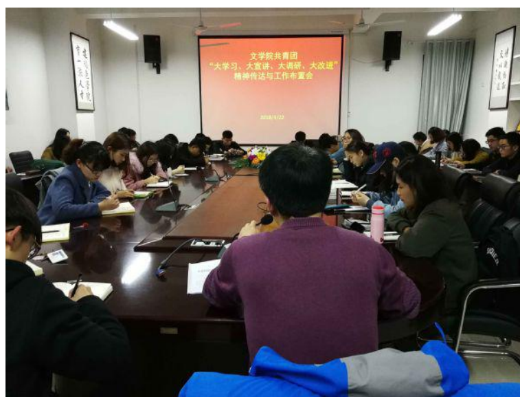
会议现场